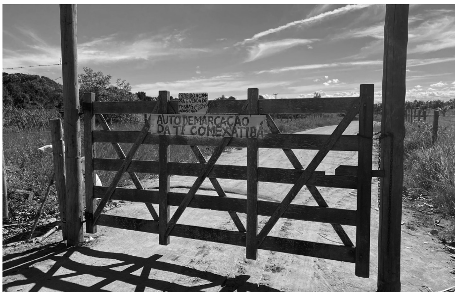
(Foto tirada pela autora em 15/02/2025. Na placa central está escrito “Autodemarcação da TI Comexatibá” e em cima “proibida a compra e venda de terras indígenas, art 231/232”).

É comum que após retomar uma determinada área, os indígenas coloquem uma placa, geralmente com a palavra “autodemarcação”, seguida de algumas outras informações, como o nome da aldeia, da terra indígena etc. Fazendo o exercício de Latour de pensar a função prática do objeto, pode-se afirmar que a placa deseja avisar a quem quer que entre a partir dali (ultrapassar a marca da placa) que aquela terra pertence a alguém. Porém, pensando além do uso imediato do objeto, as perguntas poderiam ser outras: a quem se deseja avisar o pertencimento da terra e por quê? Por que não somente retomar fisicamente um determinado “espaço” é necessário, mas também anunciar, por meio da placa, que se retomou?